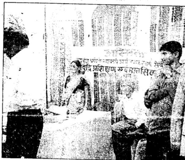
अस्मिता में हुई सैकड़ों मरीजों की निशुल्क जांच