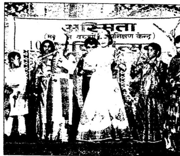
रंगारंग कार्यक्रम प्रस्तुत करते ‘अस्मिता’ संस्था के छात्र