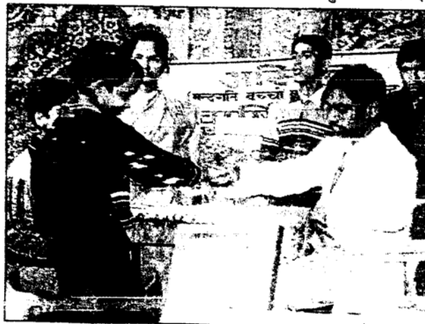
एक-दूसरे से खुशियाँ बांटते ‘अस्मिता’ संस्था के स्लो लर्नर छात्र